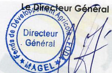
Alpha Oumar Faly DIALLO

A la fin de cette période, le solde disponible se chiffre à GNF 26 825 267 219 soit un taux d'exécution de 84, 27% .